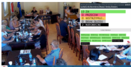
14.02 Aktualny temat: wotum zaufania dla Burmistrza Miasta i Gminy Siewierz