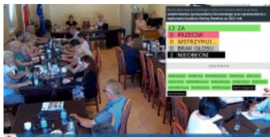
14.02 Aktualny temat: wykonanie budżetu Gminy Siewierz za 2021 rok