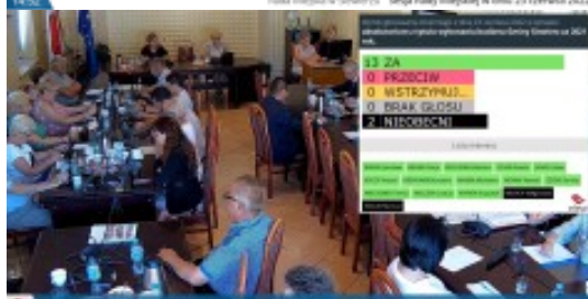
15.01 Aktualny temat: absolutorium z tytułu wykonania budżetu Gminy Siewierz za 2021 rok