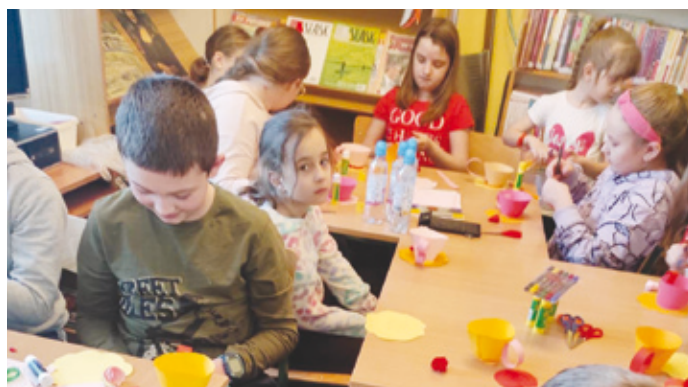
Uczestnicy zajęć feryjnych w filii bibliotecznej w Żelisławicach.

Wszystko, co dobre, szybko się kończy, jednak najważniejsze są miłe wspomnienia, a tych z pewnością uczestnikom Ferii w bibliotece nie będzie brakowało. Każdego dnia dzieci przychodziły na zajęcia z uśmiechem