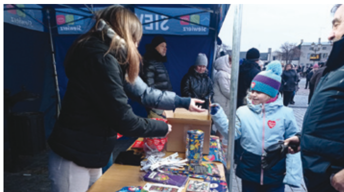
Podczas finału na Rynku popularnością cieszyły się konkursy z nagrodami.

31. Finał WOŚP wsparli: Mechanic System Sp. z o. o., Przedsiębiorstwo Produkcyjno-Usługowo-Handlowe „DOLOMIT” Kopalnia „Ząbkowice” S.A., TOPCON Polska Sp. z o.o., Górnice Zakłady Dolomitowe