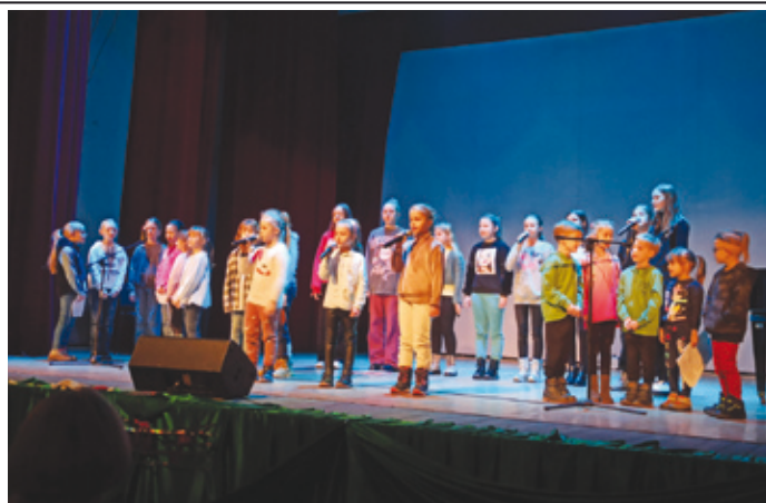
Uczestnicy zajęć karaoke mogli zaśpiewać swoje ulubione utwory muzyczne.