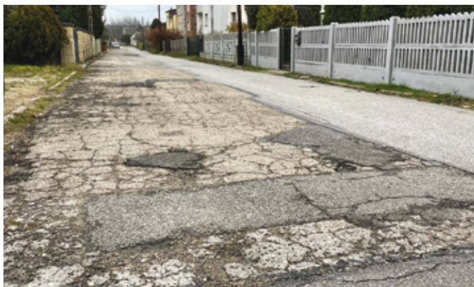
Nawierzchnia na ulicy Ogrodowej przed wykonaniem remontu.