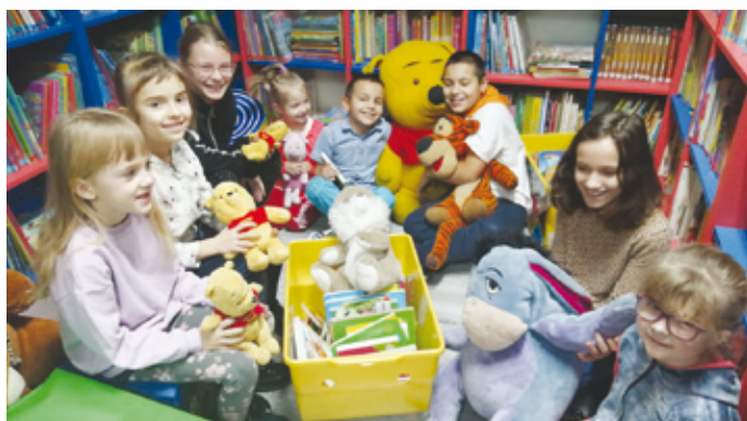
Uczestnicy zajęć w filii bibliotecznej świętowali m.in. urodziny Kubusia Puchatka.

do tematu ferii i zimowej pory roku m.in.: kolorowe bałwanki, zimowe obrazki i pejzaże, laurki oraz wielobarwne papugi. Podczas zajęć, jak na bibliotekę przystało, nie zabrakło również głośnego czytania fragmentów książek i opowiadań związanych tematycznie z zajęciami. W programie znalazły się również gry i zabawy świetlicowe, zabawa w kalambury oraz mini-loteria Lotto zorganizowana przez najstarszych uczestników zajęć. Na zakończenie zimowych spotkań bi-