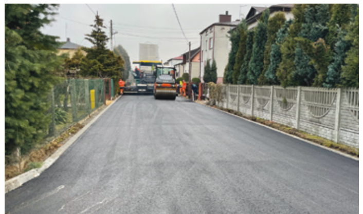
Prace obejmowały m.in. wykonanie nakładki asfaltowej oraz wymianę krawężników.

Referat Gospodarki Komunalnej i Lokalowej