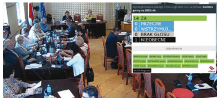
Radni jednogłośnie przyjęli budżet na 2023 rok.