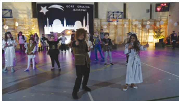
Przedstawienie jasełkowe w Szkole Podstawowej nr 2 w Siewierzu.

ujrzały i oddały cześć Dzieciątku. Poznaliśmy rodzinę baranów, która udzieliła schronienia Maryi i Józefowi, myszkę truchlejącą przed kotkiem, krowę i pająka zachwycających się nowonarodzonym Zbawicielem. Do stajenki zawitali też pastuszkowie i królowie. Możemy stwierdzić, że wspólnie z rodzicami, uczniami, pracownikami szkoły oraz zaproszonymi gośćmi stworzyliśmy nasze Siewierskie Betlejem.