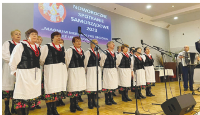
Występ Zespołu Śpiewaczego KGW Gołuchowice.