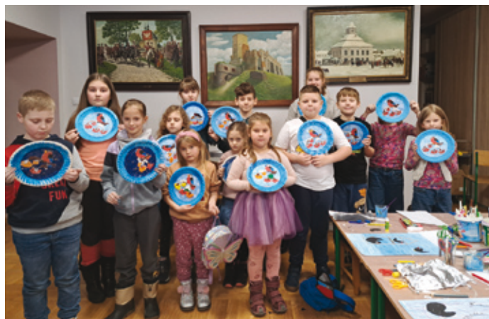
W trakcie zajęć feryjnych uczestnicy wykonywali rozmaite prace plastyczne.

Miejsko-Gminna Biblioteka Publiczna w Siewierzu