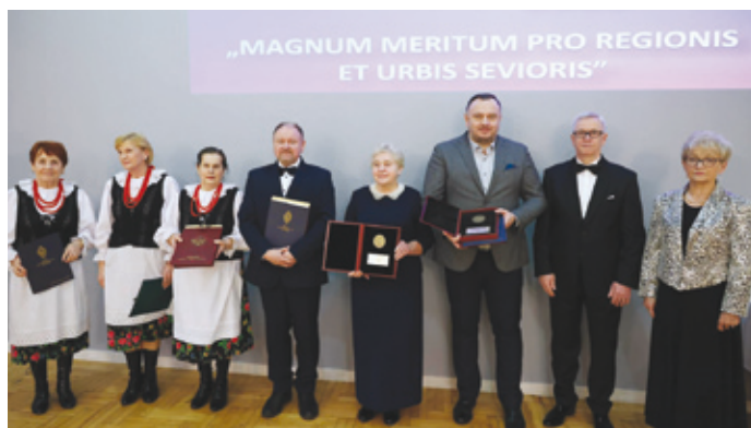
Laureaci nagrody Magnum Meritum Pro Regionis Et Urbis Seviensis za 2022 rok.