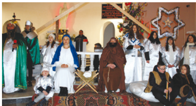
W kościele parafialnym odegrano ostatnią scenę orszaku pn. Adoracja żłóbka.